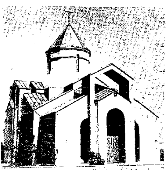
Ս. Ջուռաշիցի Մանկանց Կառարուածը Երեւանի Օրմեզ Գառնիի մէջ

Արդարեւ, ճամբու ընթացքին՝ կը մեռնի նաեւ անիկա: Պահակները կը կատարեն իրենց պարտականութիւնը, կը հրկիզեն