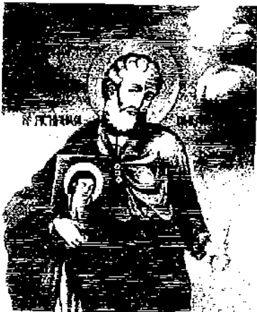
Ս. ԲԱՐԹՈՂԻՄԵՆՍ ԱՌԱՔԵԱԼ