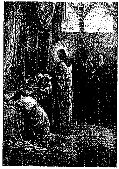
ՅԻՍՈՒՍ ԱՂՋԻԿԸ ԵՐԿՈՒՅԻՆԸ

Աւետարաններուն մեղի հազարգում տեղեկութեան համեմատ Յիսուս երեք մեռելներ միայն աղջնուցած է: Ասանցմէ մէկն է Նայիվի պատանին (Ղուկ. Է. 11-17) որ իր մօրը միակ դուստին էր: Երկրորդը Յայրուսի աղջիկն է (Մատթ. Թ. 23-26: Մարկ. Ս. 35-43: Ղուկ. Ը. 49-56) որ ասաներից տարեկան հասակին մեռած էր: Իսկ երրորդն է Բեթանիացի Ղազարոսը (Յովհ. ԺԱ. 17-44) որ չորս օր առաջ մեռած ու թաղուած էր՝ երբ Յիսուս այցելեց անոր գերեզմանը: Ասանցմէ առաջին երկուքը երիտասարդ էին և ասկաւին չթաղուած աղջնցան, իսկ երրորդը չափահաս սարիքին մեռած էր և չորս օր գերեզմանին մէջ մնալէ յետոյ է որ ասացաւ իր երկրորդ կեանքը: