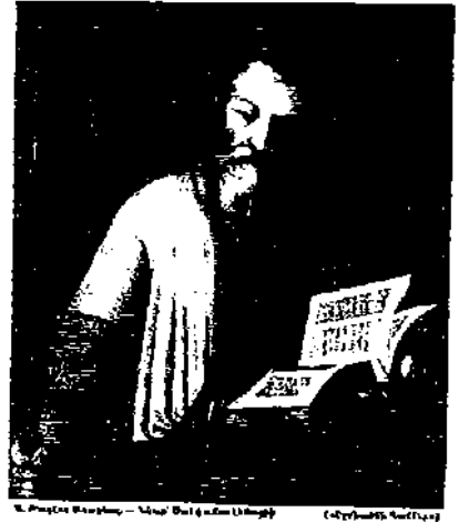
Ս. Թաղէս Թաղապարհապետը (Վերջին Պատկերը) (Գրեթեմ Կաթիլ)